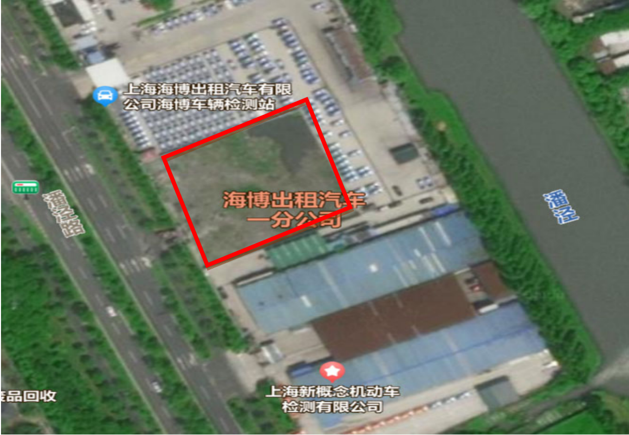
加油站地理位置图

本加油站新建项目位于上海市宝山区顾村镇：四至范围东至 28A-01 地块，西至潘泾路绿化带（28A-03），南至 28A-01 地块，北至 28A-01 地块。加油站车辆入口设在潘泾路南侧，出口设在潘泾路北侧，加油站进出口之间为开式围墙，站区其余三侧为高度为 2.2m 的非燃烧实体围墙。南侧为新概念机动车检测公司、西侧为潘泾路、北侧为海博出租汽车公司、东侧为海博出租汽车公司。